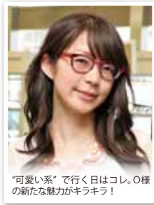
「可愛い系」で行く日はコレ。O様の新たな魅力がキラキラ!