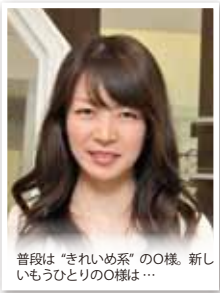
普段は「きれいめ系」のO様。新しいもうひとりのO様は...